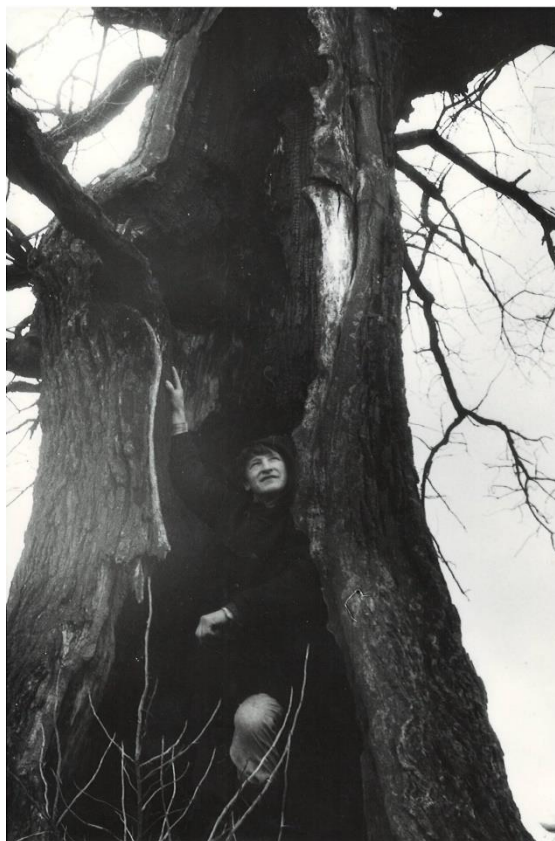
O.Slišāns 1995.goda aprēlī pi Mukaušovys dižūzula.