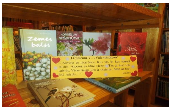
Izstāde veltīta Valentīndienai.

Rokdarbi rudens vakariem - „Raksti, raksti, skrīverīti, no grāmatas grāmatā; Tā rakstīja mūs māsiņa, no parauga paraugā.” /Latv.t.dz./ Izstādē uzlikti materiāli kur ir sniegti dažādi padomi, kā vienkāršāk apgūt tradicionālos rokdarbu veidus, kā tekstilmozaīku, izšūšanu ar krustdūrieniem, gobelēnizšuvumu darināšanu, zīda apgleznošana, stikla apgleznošana.u.t.t. Kā darināt skaistus mājsaimniecības piederumus, burvīgas dāvanas, apģērbus un izsmalcinātus aksesuārus. Var atrast radošas idejas un izsmelošas instrukcijas dažādiem rokdarbiem.