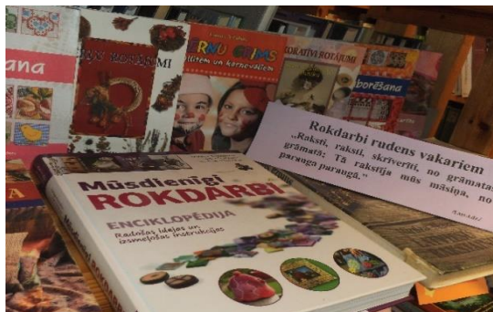
Lielā cieņā ir arī rokdarbu žurnāli un grāmatas.

10.novembrī – Mārtiņdiena „ Mārtiņam gaili kāvu, deviņiem cekuliem. Lai tek mans kumeliņš, deviņiem celiņiem.” /Latv.t.dz./